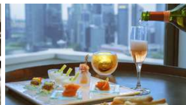
晚間雞尾酒及開胃點心 (晚上6:00至8:00)